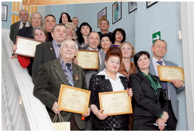
1. Диплом победителям. 2. Момент церемонии награждения.